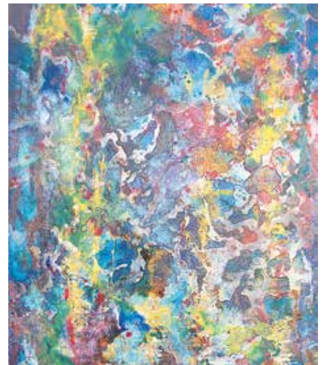
Έργο της Θάλειας Ποντίκη

Ο Ψαραντώνης με τα παιδιά του δίνουν μια μοναδική συναυλία απόψε στην Αξιοθέα με γνωστές επιτυχίες του αλλά και νέα κομμάτια