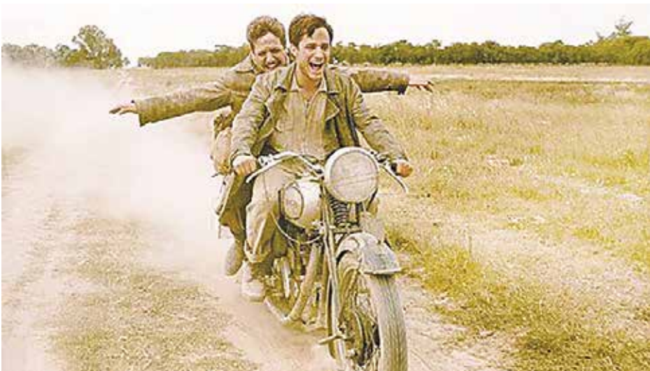
Τα «Ημερολόγια Μοτοσυκλέτας» του Βάλτερ Σάλες θα δούμε στο Έρμα

Επιμέλεια: Μαρία Παναγιώτου - maria.panayiotou@phileleftheros.com